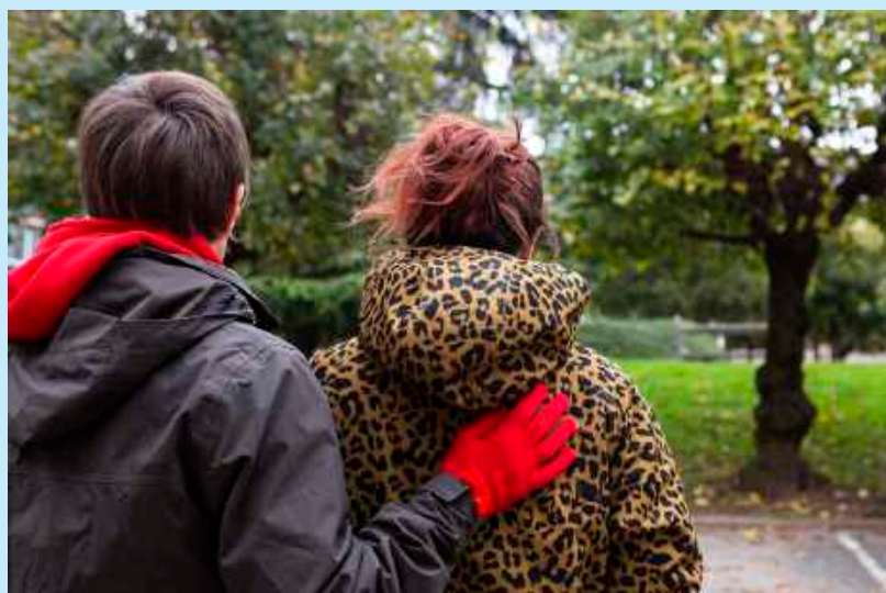
A Little Piece of Care • Aline Fayard

Le corps comme relation, A Little Piece of Care et Une danse ancienne bénéficient d'une coproduction du Pacifique.