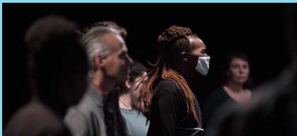
Hymen Hymne • Nina Santes

Milène Duhaméau monte à bord du Pacifique du 12.10 au 16.10 pour continuer à créer sa nouvelle pièce D.U.O (titre provisoire) qui explore la relation à deux sous ses multiples facettes.