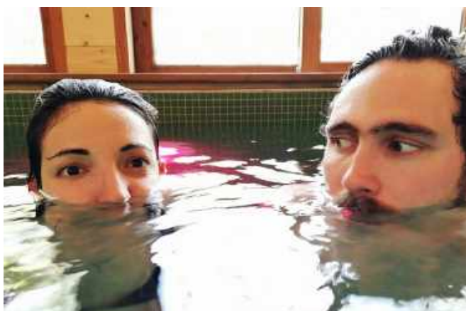
© Paola Stella Minni & Konstantinos Rizos

Nos nouveaux artistes associés seront en résidence du 26.08 au 18.09 pour travailler sur SILVER , une création à découvrir au Pacifique JEU 21.01.21 à 19h30. Du 30.11 au 18.12, ils remonteront à bord pour créer Tirésias qui sera présenté en juin 2021.