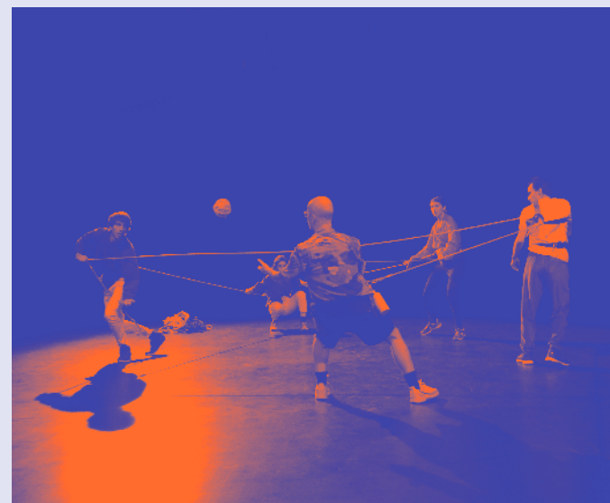
Forces de la nature © Alik Boillot