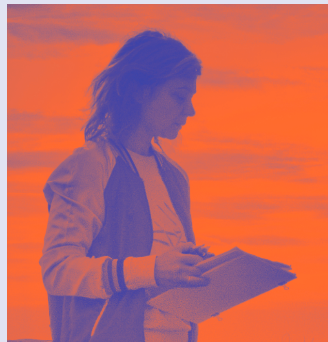
Ivana Müller © Gerco de Vroeg