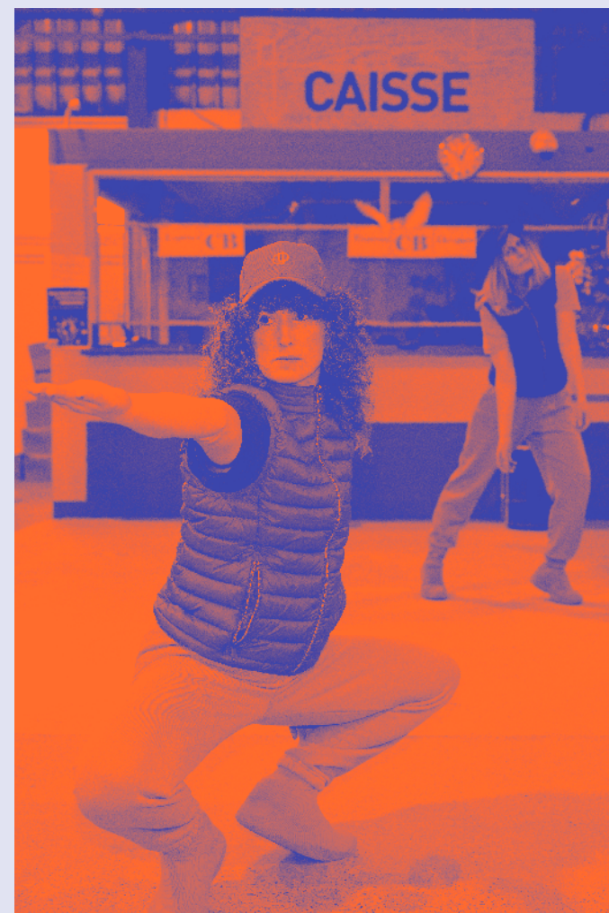
Délivrés, LN Iratchet